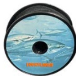
20Mケーブルワイヤー