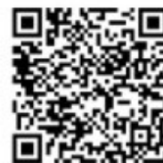
マニュアル こちらへ